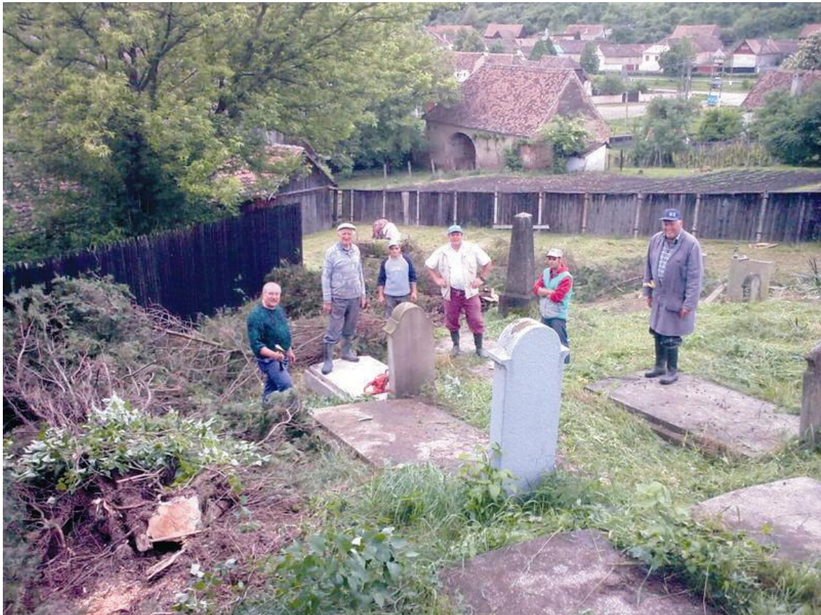
Helfer bei der Arbeit im Baaßner Friedhof – April 2010