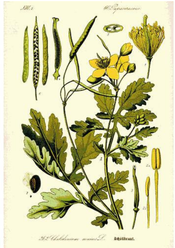
Schöllkraut ( Chelidonium majus )

Das „Schleppkriekt“ fand aber auch im alltäglichen Leben Anwendungen, zum Beispiel in der Warzenbekämpfung, sogar mit Erfolg, wenn es sich um die virotische Verruca vulgaris handelte. Man pflückte einfach ein Blatt Schöllkraut, drückte auf den Stiel und mit dem austretenden gelben Saft schmierte man die Warzen ein, so dass sich eine gummiartige Haut darüber bildete. Bei guter Isolation konnte die Warze schon nach ein paar Tagen abfallen.