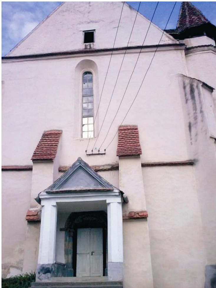
Ein feste Burg ist unser Gott